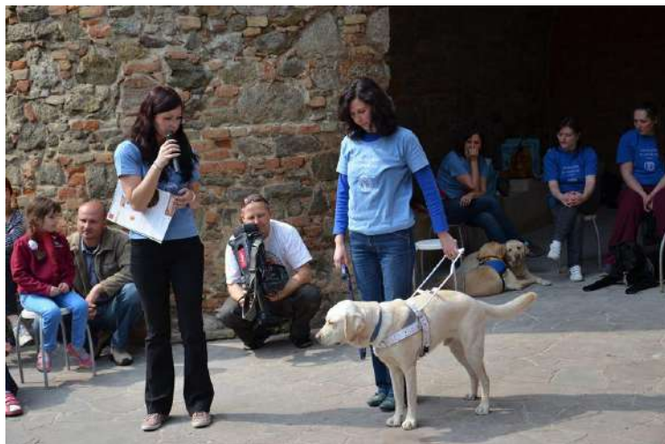
Prezentácia našej práce v Letnej čítárni U červeného raka

Letná čítareň U červeného raka opäť privítala našich trénerov a ich štvornohých zverencov v rámci podujatia Bratislava pre všetkých 2014 v sobotu 26.4. pod Michalskou bránou. Okrem základných informácií o fungovaní, programoch a projektoch VŠVP boli súčasťou prezentácie aj ukážky z výchovy a výcviku vodiaceho psa.